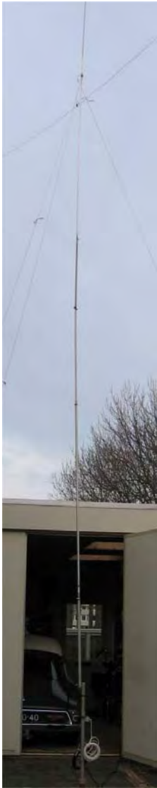
De antenne van pa3ds opgesteld in de tuin.