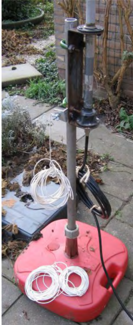
Detail van de mastvoet.