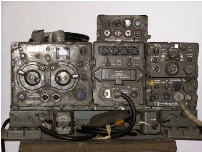
Vakantie foto van PE1PMO.