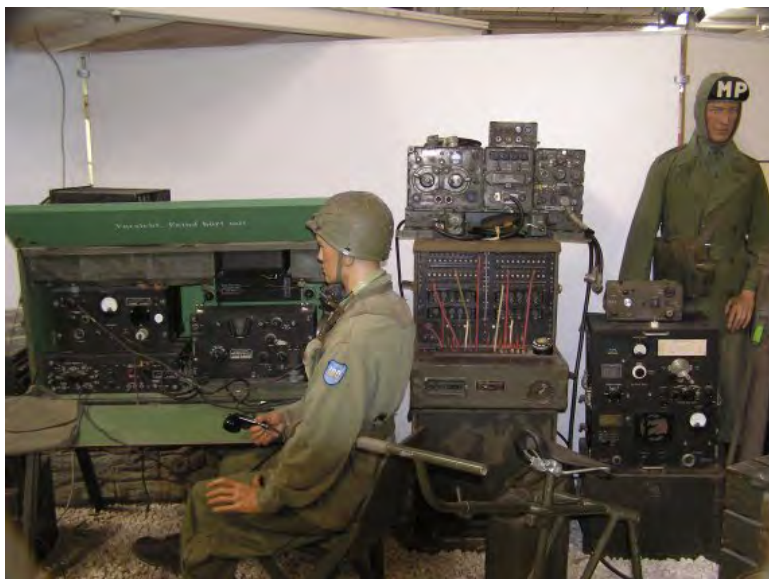
Vakantie foto van PE1PMO.