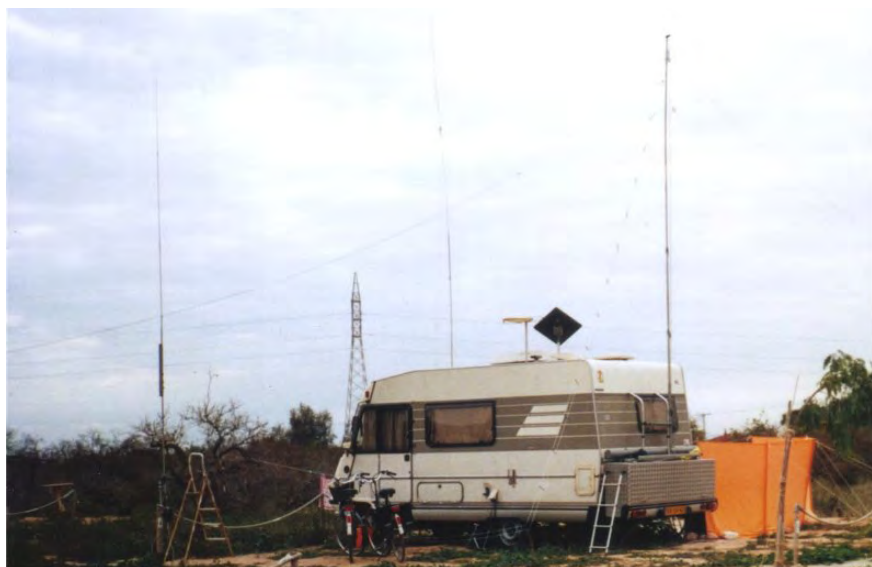
Het antennepark van EA/PA3DS

Een 5-band GP dus. Het log zal ik nog een keer in z'n geheel, uitgesplitst per antenne publiceren. Er zitten heel wat leuke DX-stations tussen.